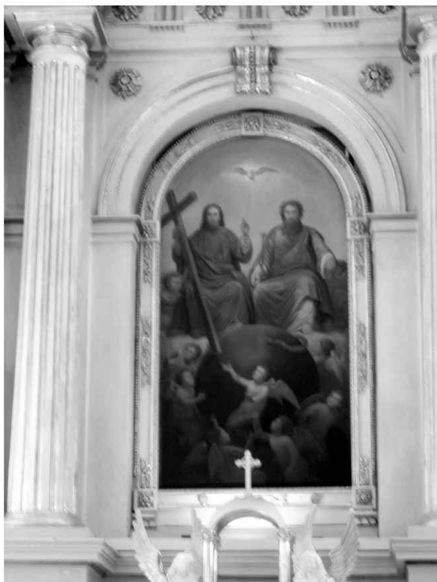
26. Obraz św. Trójcy w ołtarzu głównym na zasuwie.