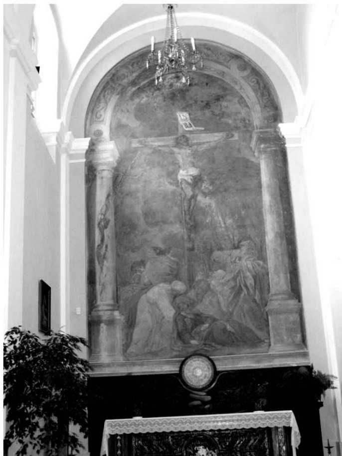
36. Ukrzyżowanie Michelangela Pallonego w północnej kaplicy fary węgrowskiej.