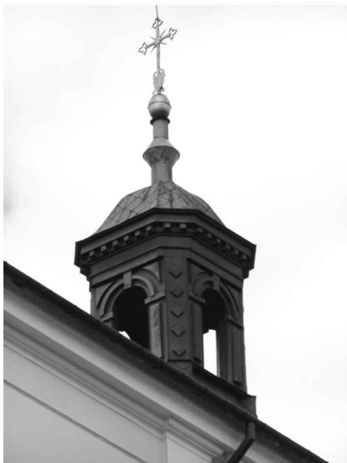
14. Sygnaturka na dachu kościoła.