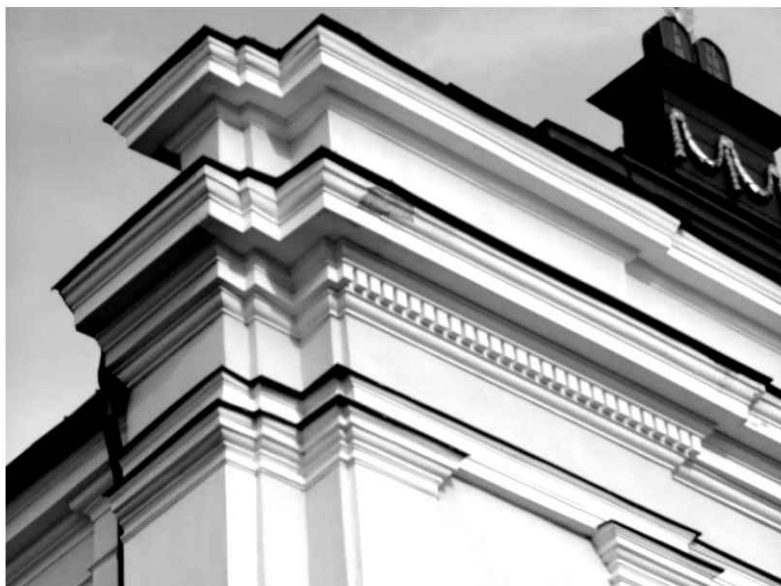
10. Kościół. Widok północnej części zwieńczenia fasady.