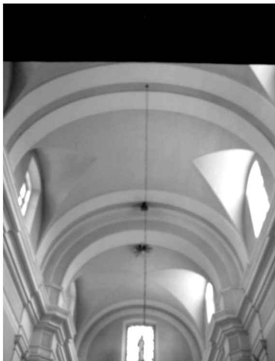
19. Kościół. Widok na sklepienie nawy głównej i prezbiterium.