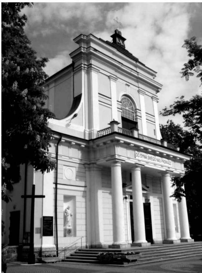
1. Kościół p.w. św. Stanisława w Siedlcach. Widok od strony północno-zachodniej.