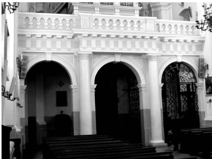
23. Kościół. Arkady chórowe.