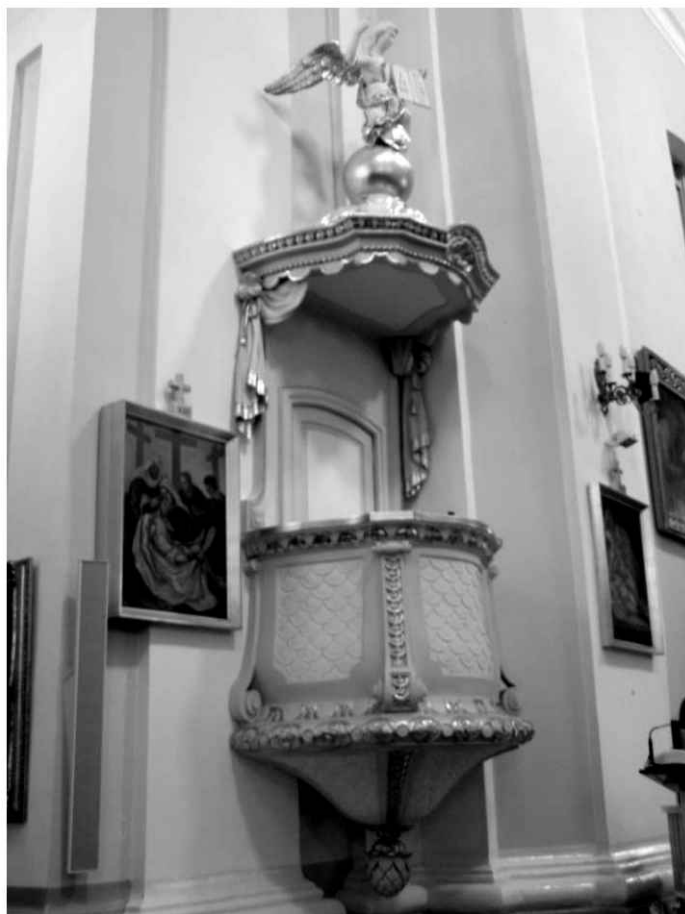
29. Kościół. Ambona.