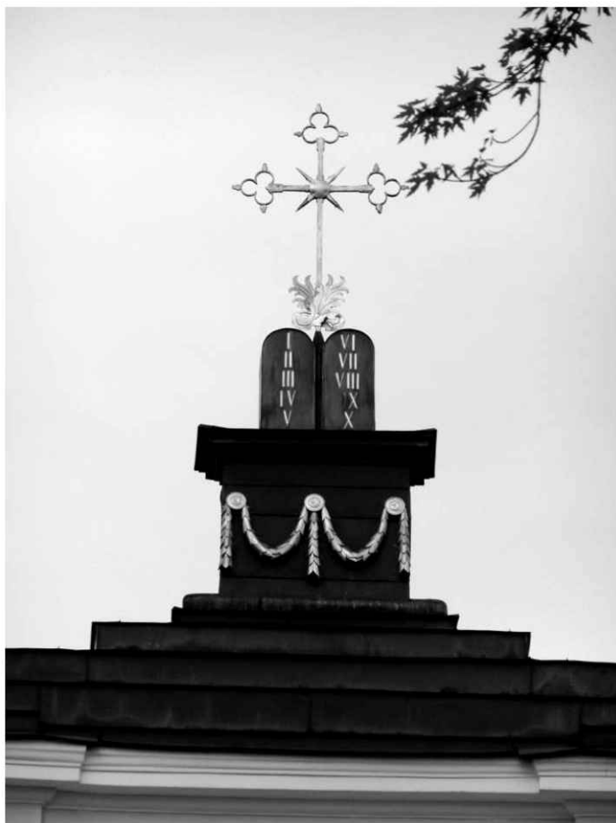
13. Kościół. Widok na szczyt fasady.