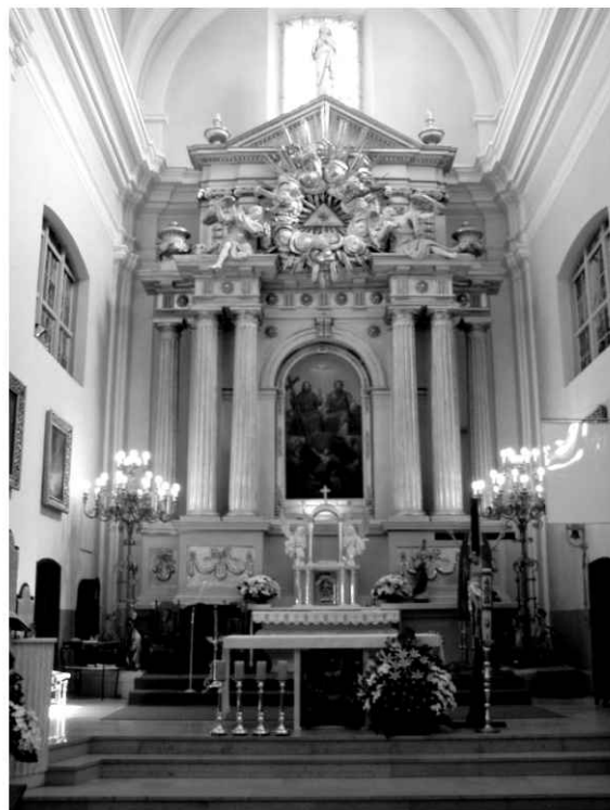
17. Kościół. Widok prezbiterium z ołtarzem głównym.