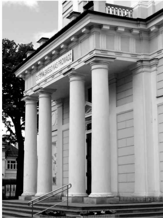
8. Kościół. Widok portyku od strony południowo-zachodniej.