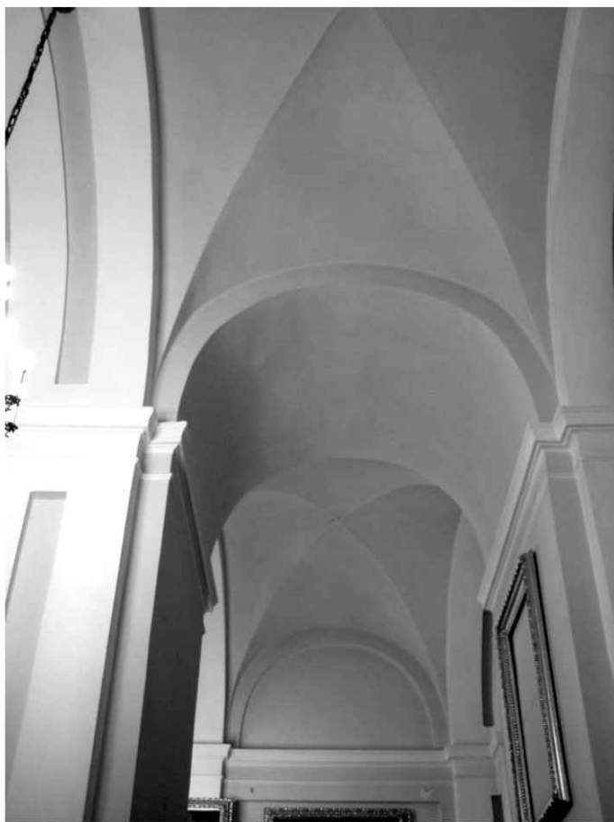
21. Kościół. Widok wschodniej części nawy bocznej.