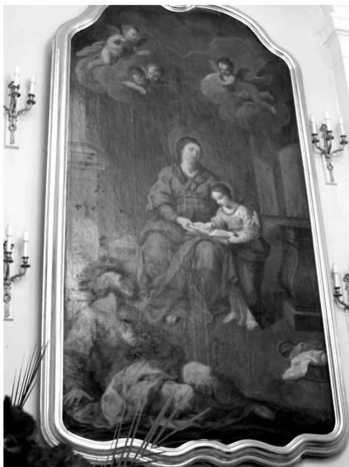
32. Nawa południowa. Obraz – św. Anna nauczająca Marię.