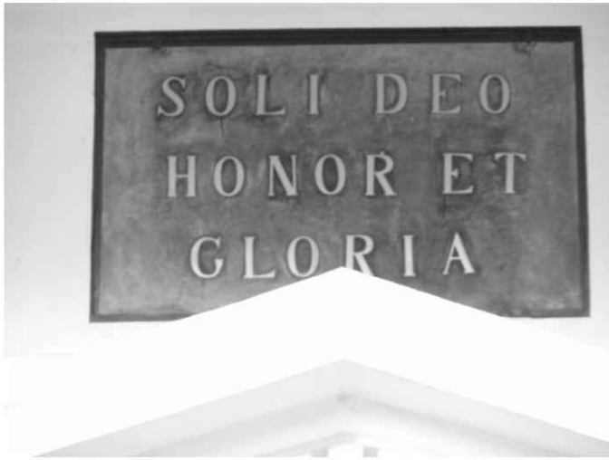
7. Kościół. Epitafium powyżej portalu w fasadzie.