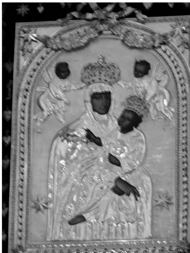
27. Obraz Matki Boskiej Śnieżnej w ołtarzu głównym.