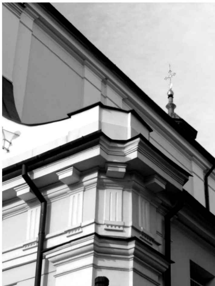
4. Kościół. Widok na południowy narożnik fasady.