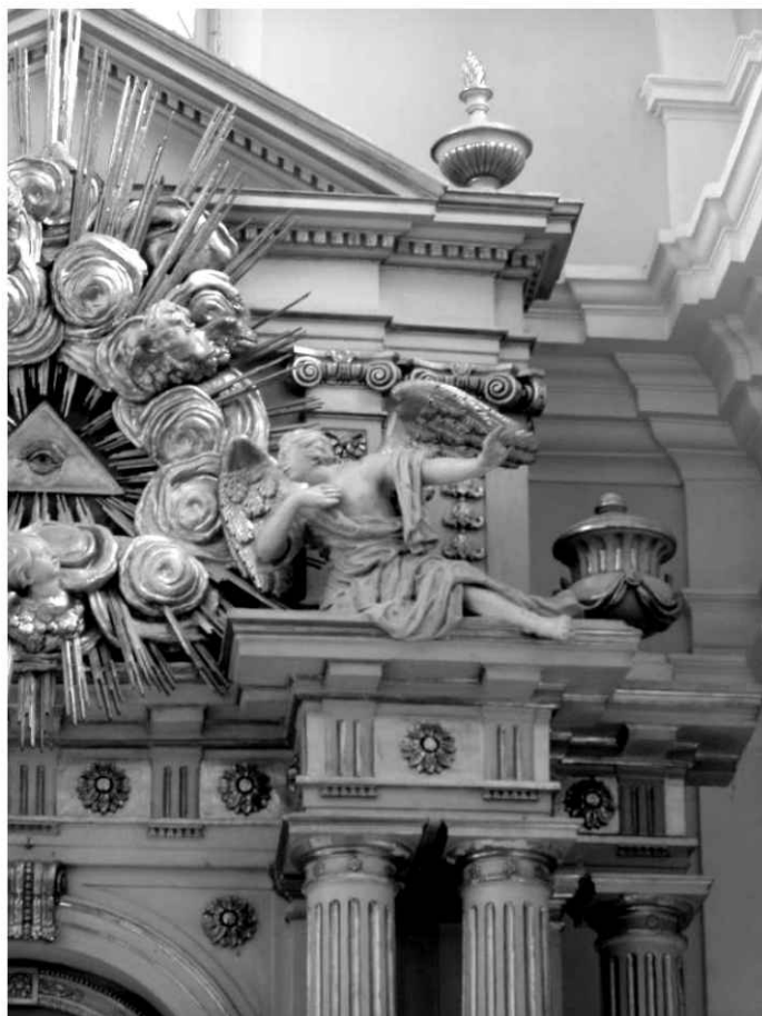
25. Kościół. Fragment ołtarza głównego.