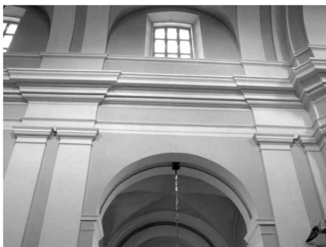
18. Kościół. Widok na północną ścianę nawy głównej.