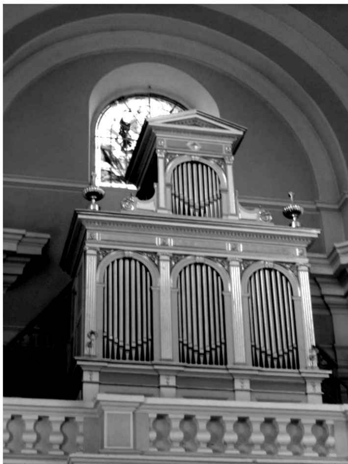
24. Kościół. Prospekt organowy.