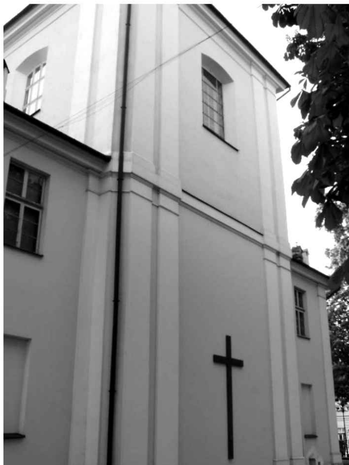
15. Kościół. Widok na wschodnią facjatę.