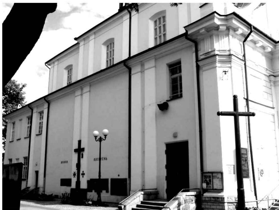
12. Kościół. Widok na północną stronę.