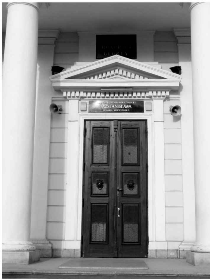
6. Kościół. Portal w zachodniej fasjacie kościoła.