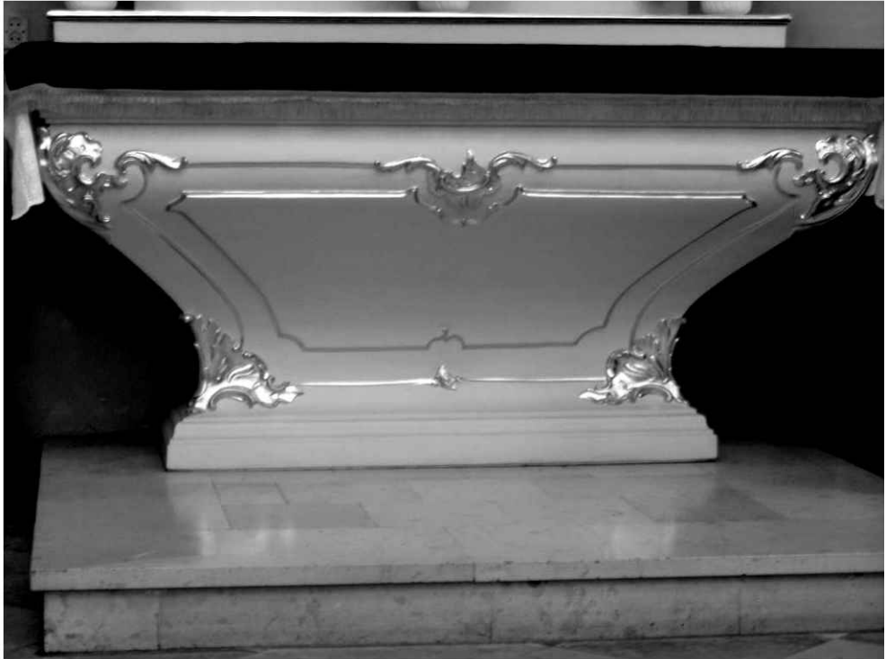
35. Kościół. Mensa ołtarzowa w ołtarzach bocznych.