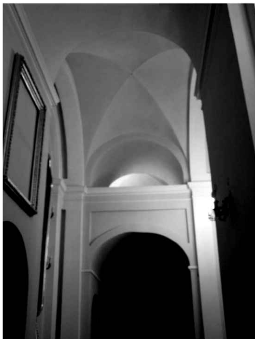
22. Kościół. Widok zachodniej części nawy bocznej.