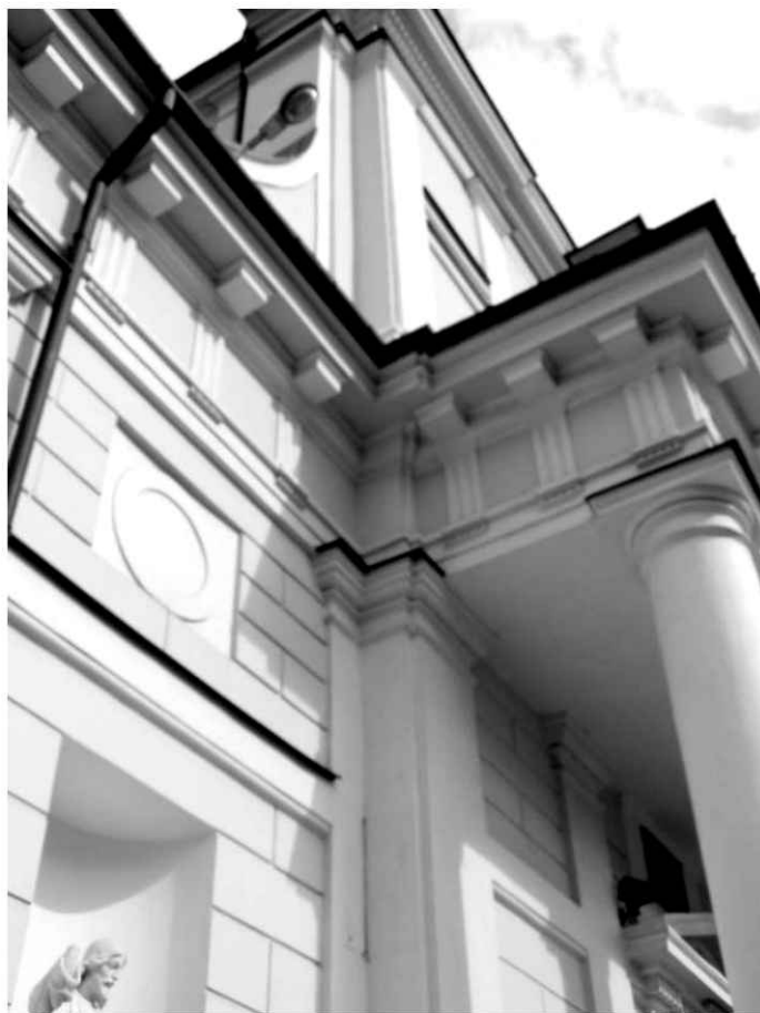
9. Kościół. Widok na fasadę od strony północno-zachodniej.