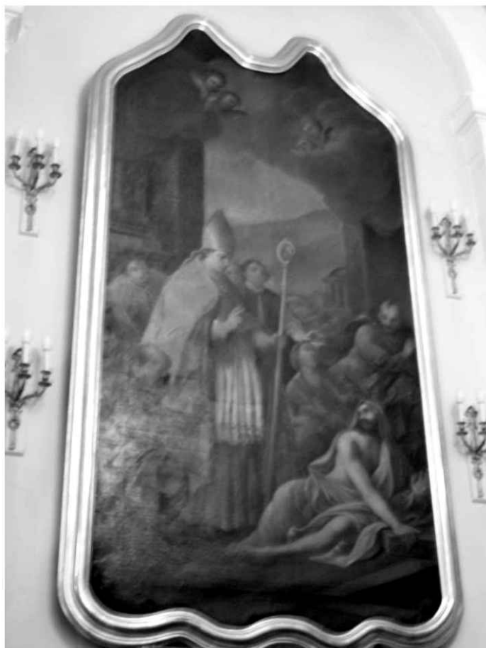
33. Nawa południowa. Obraz – św. Stanisław wskrzeszający Piotrawina.