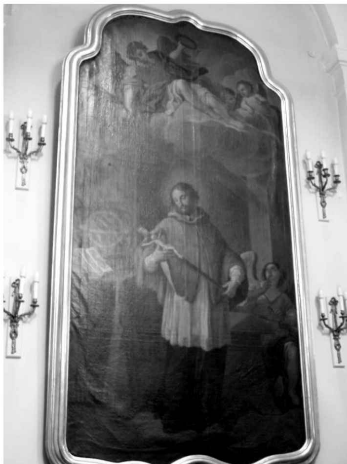
34. Nawa północna. Obraz – św. Jan Nepomucen.