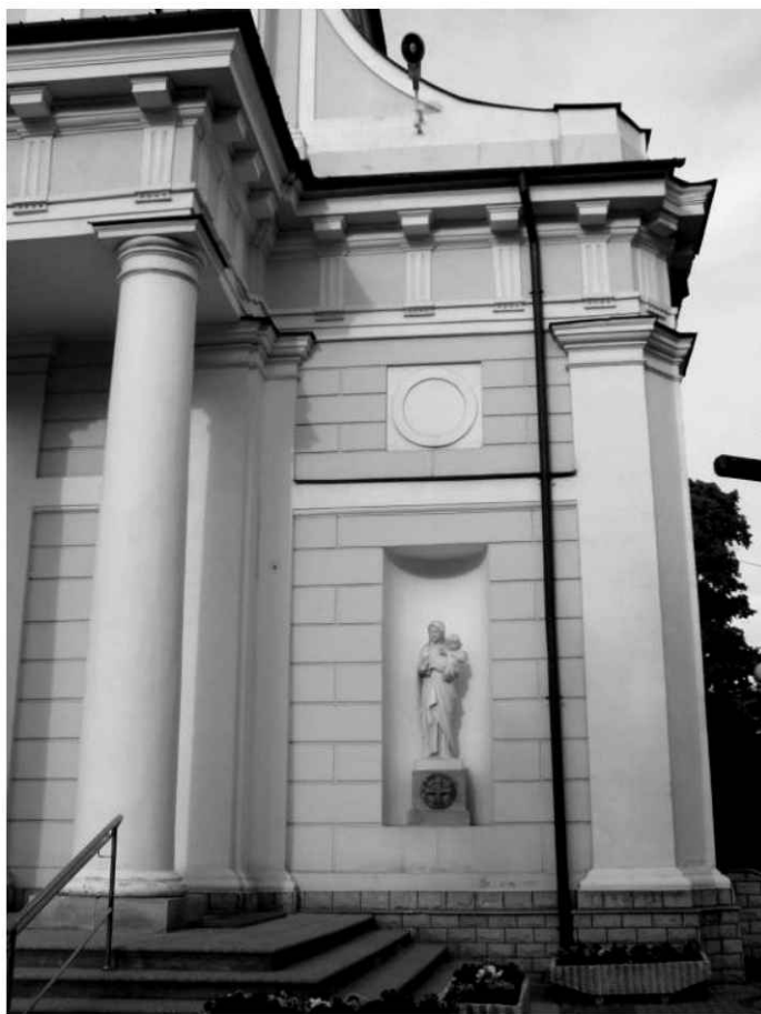
5. Kościół. Widok na południową część dolnej kondygnacji fasady.