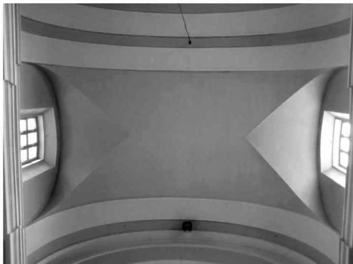
20. Kościół. Widok pojedynczego przęsła sklepienia.