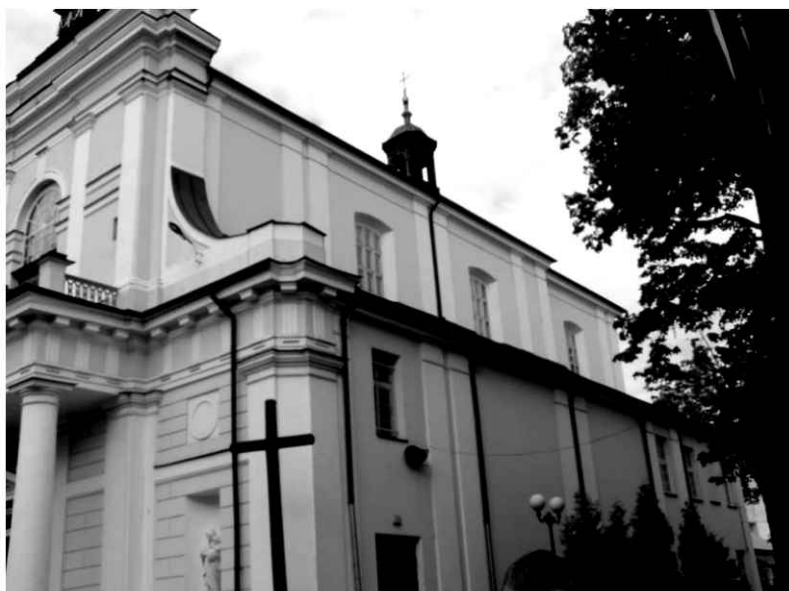
11. Kościół. Widok na południową stronę.