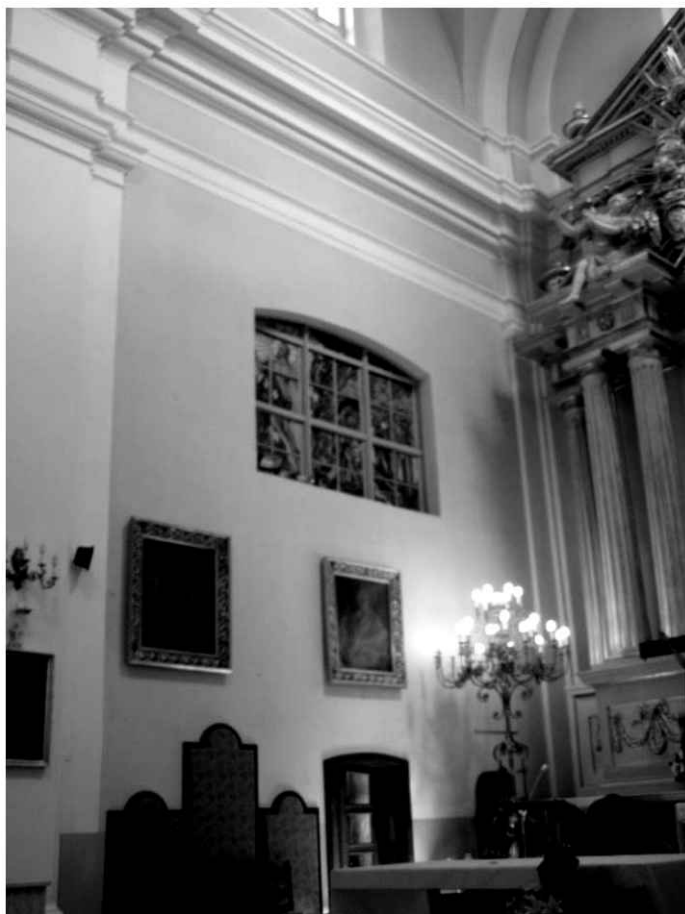
28. Kościół. Widok północnej ściany prezbiterium.