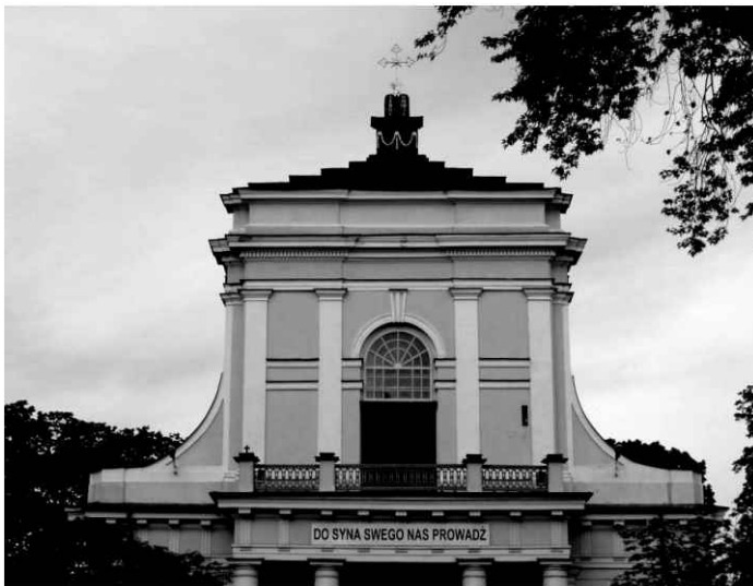
3. Kościół. Widok górnej części fasady.