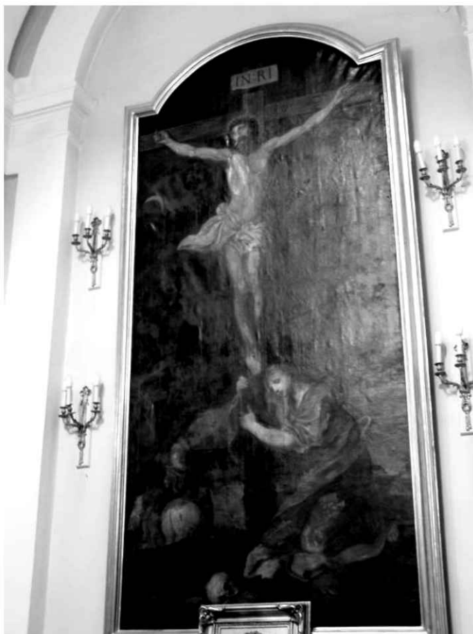
31. Nawa północna. Obraz – Ukrzyżowanie.