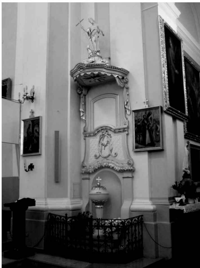
30. Kościół. Chrzcielnica z obudową.