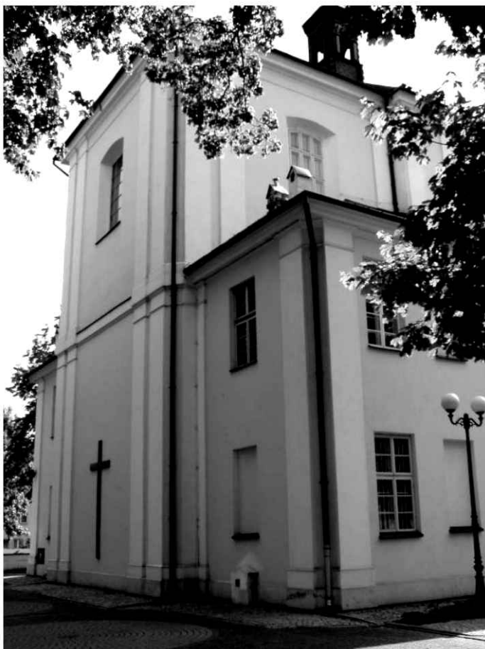
16. Kościół. Widok na północno-wschodnią część.