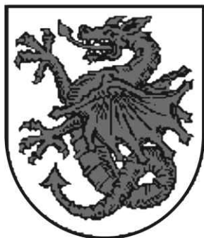
Ryc. nr 1. Herb księstwa czerskiego