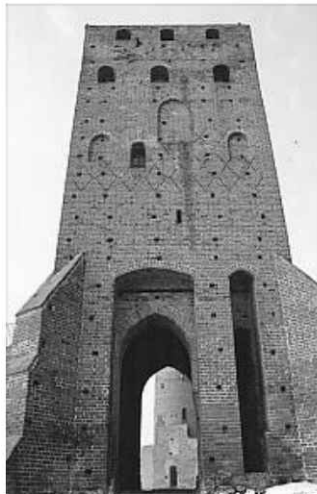
Ryc. nr 3. Baszta bramna zamku czerskiego

cza, że był już wówczas za takie uważany i najprawdopodobniej miał już prawa miejskie. Okoliczne wsie (w 1363 roku Cieciszewo, a w 1368 roku Chebdzino i Brzeźnice) lokowane były bowiem na prawie niemieckim, takim, jakim cieszył się Czersk 11 . Oznacza to, że przed 1350 rokiem, może nawet w tym samym mniej więcej czasie gdy nastąpiła lokacja Warki (1321 rok), miała miejsce pierwsza lokacja Czerska 12 . Miasto najprawdopodobniej zajęło teren dawnego podgrodzia, choć raczej bez pozostającego do dziś w ręku Kościoła wzgórza północnego („Poświętne”), a może i bez środkowego, gdzie dziś stoi kościół parafialny 13 . Nie była to jednak lokacja udana, co wynika wprost z aktu ponownej lokacji.