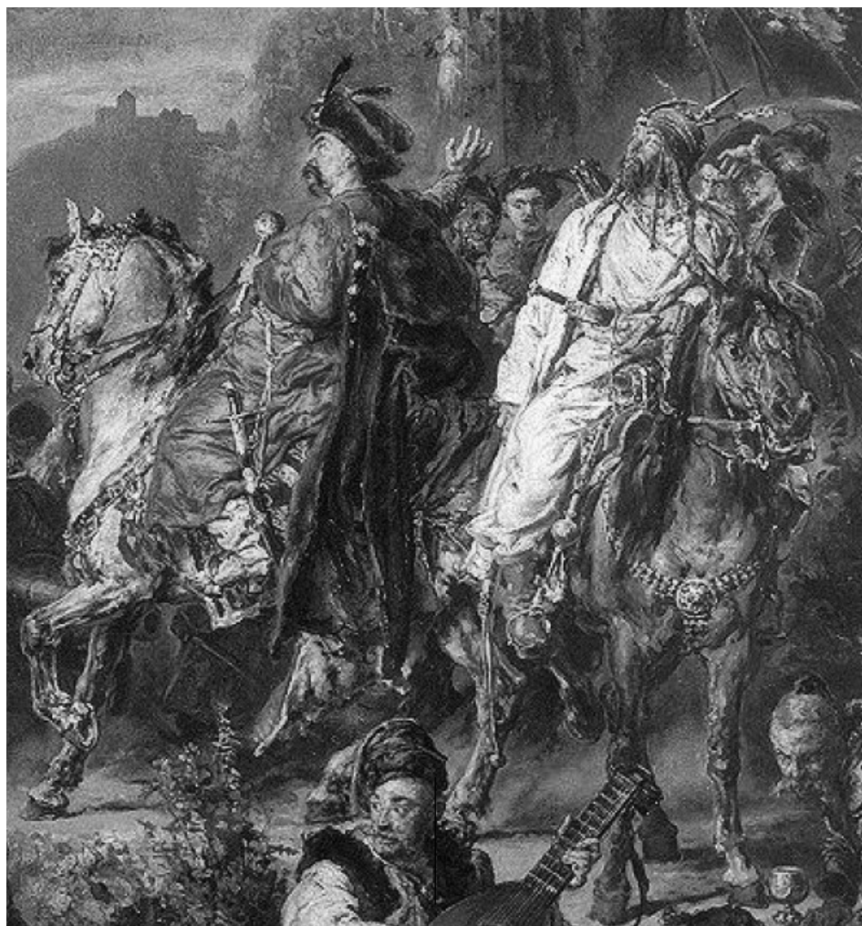
Jan Matejko, 1885 r., obraz, olej na desce, 130 x 79 cm, Muzeum Narodowe, Warszawa

Bohdan Chmielnicki z Tuhaj-Bejem pod Lwowem.