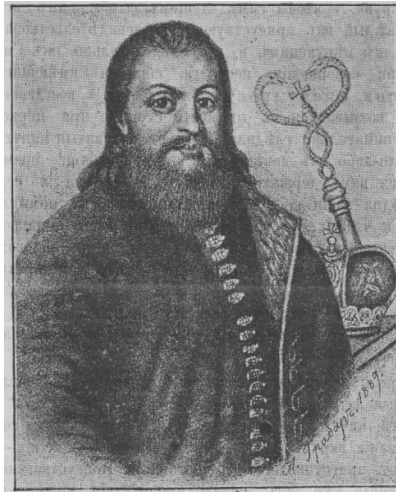
II. 1. Wasyl Tarasowycz, biskup mukaczewski z lat 1633–1651.

wyznanie wiary (II. 1). Z tego powodu biskup doznał represji ze strony rodziny książąt siedmiogrodzkich. Jerzy I Rakoczy uwięził go na zamku mukaczewskim. Ostatecznie został on zmuszony do wyrzeczenia się unii 50 .